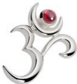
Anhänger 925er Silber Größe: 20 x 25 mm Stein: Granat Art Nr. 1830 39,- EUR