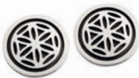
BLUME DES LEBENS OHRSTECKER

925er Silber, teilgeschwärzt Größe: Ø je 12 mm Art Nr. 2933 29,- EUR