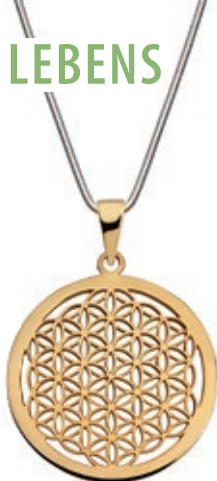
BLUME DES LEBENS

925er Silber Größe: Ø 30 mm Art Nr. 1823 35,- EUR