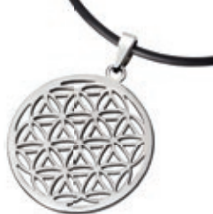
BLUME DES LEBENS

925er Silber, vergoldet Größe: Ø 30 mm Art Nr. 1199 42,- EUR