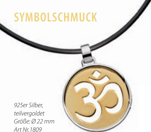
925er Silber, teilvergoldet Größe: Ø 22 mm Art Nr. 1809 49,- EUR