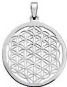
BLUME DES LEBENS

925er Silber Größe: Ø 30 mm Art Nr. 1823 35,- EUR